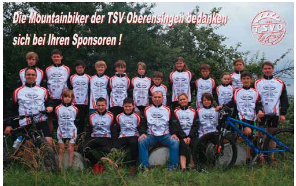
Das ist die Mountainbike-Abteilung der TSV Oberensingen.